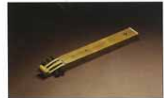
Épinette des Vosges