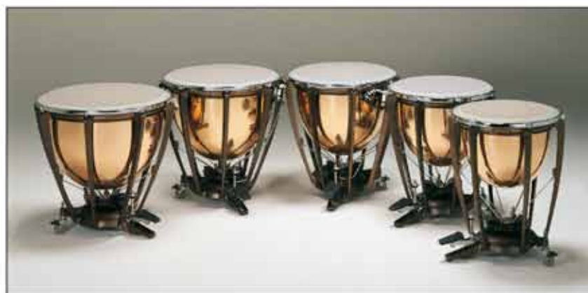
TIMBALES A PEDALE