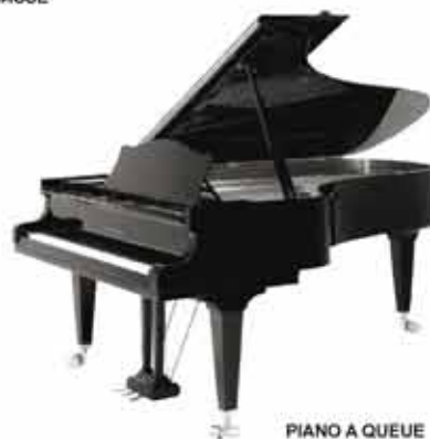
PIANO A QUEUE