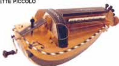
VIELLE A ROUE