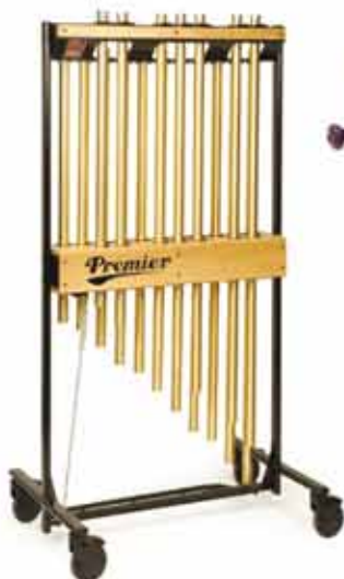
JEU TUBES CLOCHES