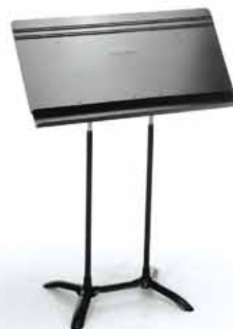
PUPITRE DE CHEF

123 rue LAMARCK 78 bis rue d'ALSACE-LORRAINE